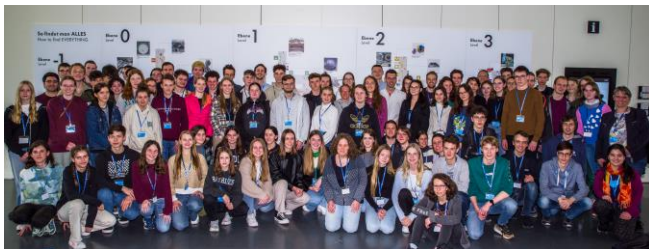
Exkursion der Eliteakademie zum Deutschen Museum in München im Mai 2023

Mache in einem echten Universitätslabor spannende chemische Experimente. Tauche in das Leben der Studierenden ein, höre interessante Vorträge und Vorlesungen, nehme an Exkursionen teil und erlebe Chemie mal ganz anders.