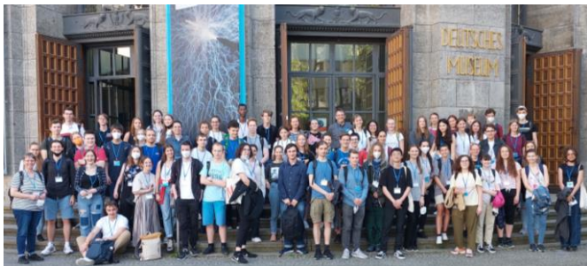
Exkursion der Eliteakademie zum Deutschen Museum in München im Mai 2022

Mache in einem echten Universitätslabor spannende chemische Experimente. Tauche in das Leben der Studierenden ein, höre interessante Vorträge und Vorlesungen, nehme an Exkursionen teil und erlebe Chemie mal ganz anders.